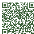
Zugang Mensasystem gabel1